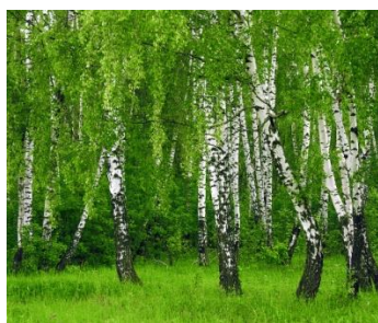
3. береза повислая