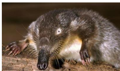
2. выхухоль русская