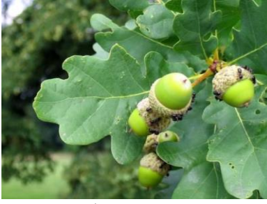
1. дуб черешчатый

23. Какая порода деревьев была введена в состав древостоя Каштакского бора благодаря искусственным посадкам?