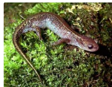
4. сибирский углозуб

12. Мрамор с Прохоро - Баландинского месторождения можно встретить: