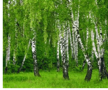
3. береза повислая