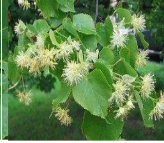
2. липа сердцевидная