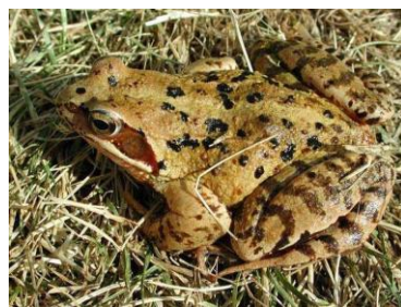
3. травяная лягушка