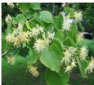
2. липа сердцевидная