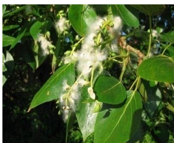
1. тополь белый

3. Какое дерево из нижеперечисленных является господствующей породой в древостое Каштакского бора?